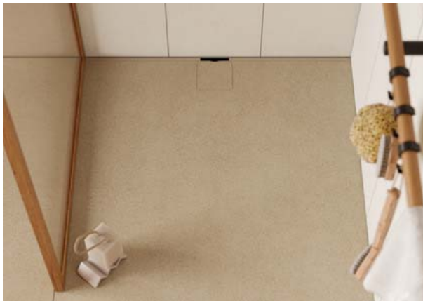
Motiv 10

Für Sanitärbereiche von Hotels, Fitness-Centern, Golfclubs etc. oder im gehobenen Wohnungsbau offeriert die neue Kollektion reizvolle Optionen wie fugenlose Duschböden (Motiv 10: Format 90x90 cm / Farbe Sandbeige) und keramische Waschtische (Motiv 11: Farbe Sandbeige) für ganzheitliche Raumkonzepte der Extraklasse.