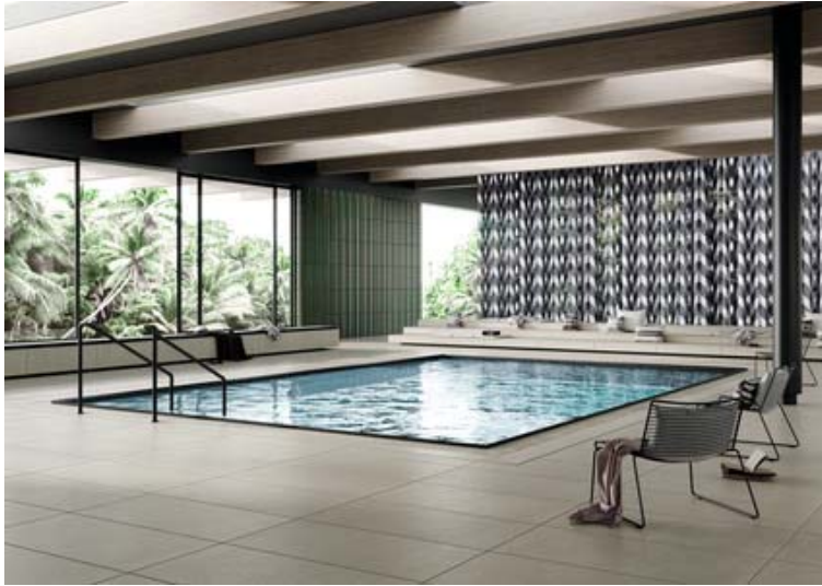
Motiv 8

Area Pro enthält auch zahlreiche Lösungen für so genannte Barfuß-Nassbereiche wie Duschen, Saunen, Umkleiden oder Beckenumgänge (Motiv 8: Format 60x120cm / Farbe Stein). Statt profaner Roste aus Kunststoff kann die Ablaufrinne auch mit einem eleganten keramischen Design-Rost abgedeckt werden (siehe Motiv 9)