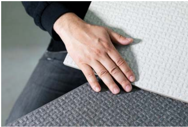
Motiv 5

Trittsicherheit neu definiert: „Grid“ (Motiv 5) wurde kreiert von Sebastian Herkner (Motiv 6), einem der renommiertesten Designer unserer Zeit mit einem Faible für funktionale Ästhetik.