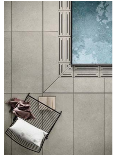
Motiv 9

Area Pro enthält auch zahlreiche Lösungen für so genannte Barfuß-Nassbereiche wie Duschen, Saunen, Umkleiden oder Beckenumgänge (Motiv 8: Format 60x120cm / Farbe Stein). Statt profaner Roste aus Kunststoff kann die Ablaufrinne auch mit einem eleganten keramischen Design-Rost abgedeckt werden (siehe Motiv 9)