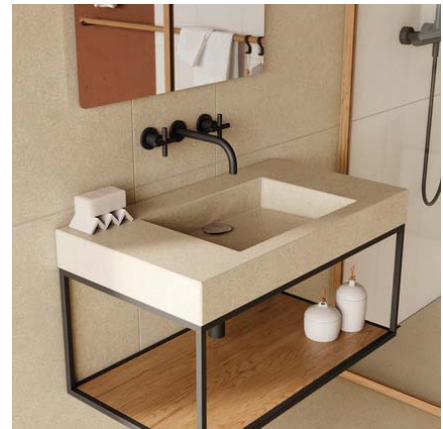
Motiv 11

Für Sanitärbereiche von Hotels, Fitness-Centern, Golfclubs etc. oder im gehobenen Wohnungsbau offeriert die neue Kollektion reizvolle Optionen wie fugenlose Duschböden (Motiv 10: Format 90x90 cm / Farbe Sandbeige) und keramische Waschtische (Motiv 11: Farbe Sandbeige) für ganzheitliche Raumkonzepte der Extraklasse.