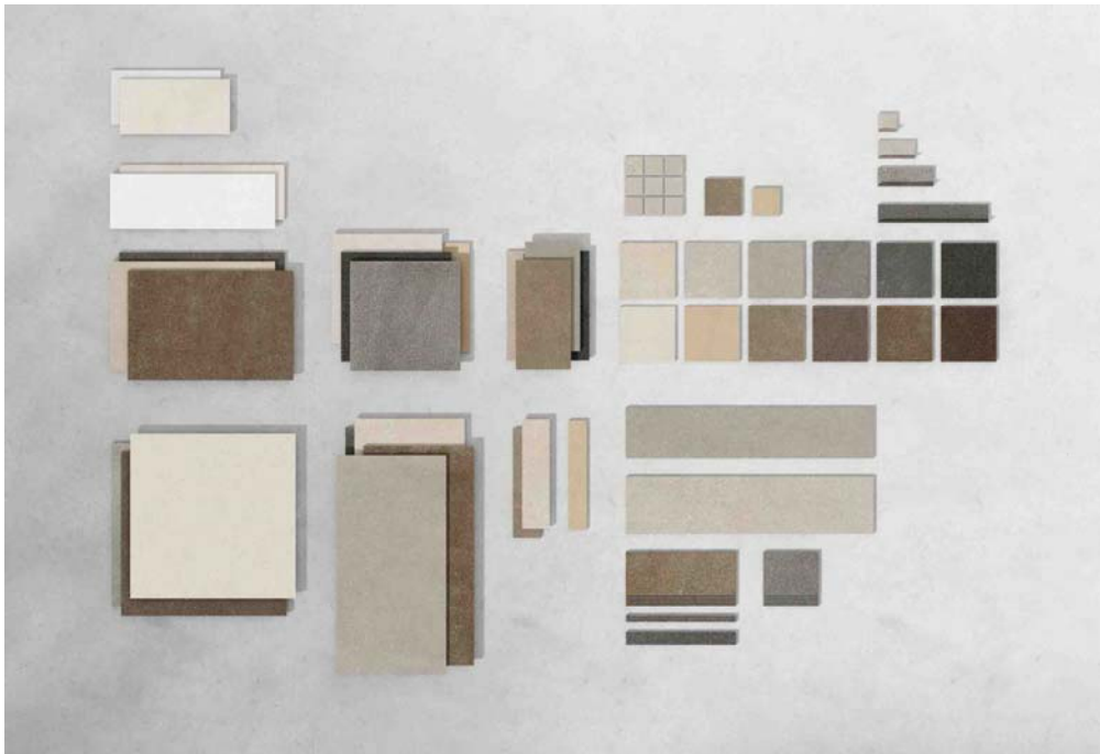
Motiv 1

Die im Herbst 2020 in den Markt eingeführte Kollektion Area Pro ist durch ihre stringente Konzeption extrem vielseitig einsetzbar in nahezu sämtlichen öffentlichen und gewerblichen Bereichen mit gestalterischem Anspruch.