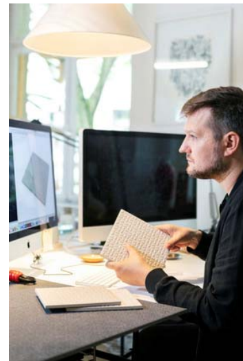
Motiv 6

Trittsicherheit neu definiert: „Grid“ (Motiv 5) wurde kreiert von Sebastian Herkner (Motiv 6), einem der renommiertesten Designer unserer Zeit mit einem Faible für funktionale Ästhetik.