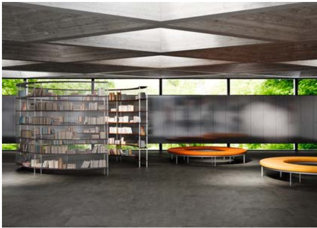
Motiv 3

Die hier abgebildete Vorhalle eines Museums mit Format 60x120cm / Farbe Basalt ist ein exemplarisches Beispiel für zahllose weitere Einsatzmöglichkeiten.