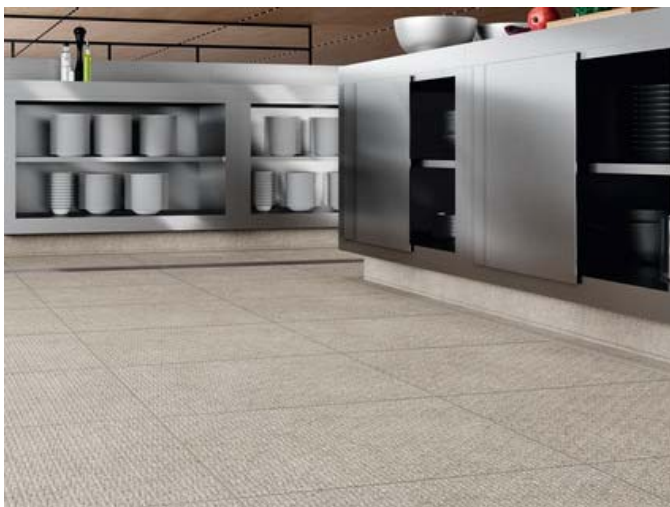
Motiv 7

„Grid“ (hier: 60x60 cm / Farbe Sandgrau) bietet hohe Trittsicherheit (R12V4) und neuartige ästhetisch-praktische Vorzüge, z.B. in Großküchen mit Linien-Entwässerung (siehe Bildmitte zwischen den beiden Möbelblöcken, deren Fuß mit den keramischen Kehlsockeln von Area Pro ausgeführt ist)